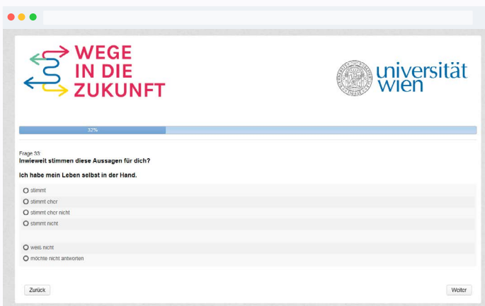
Oben: Die Online-Umfrage

„Wege in die Zukunft“ läuft bis 2021. Wir würden dich bis dorthin gerne 1 Mal im Jahr befragen, um zu sehen, wie sich dein Leben verändert.